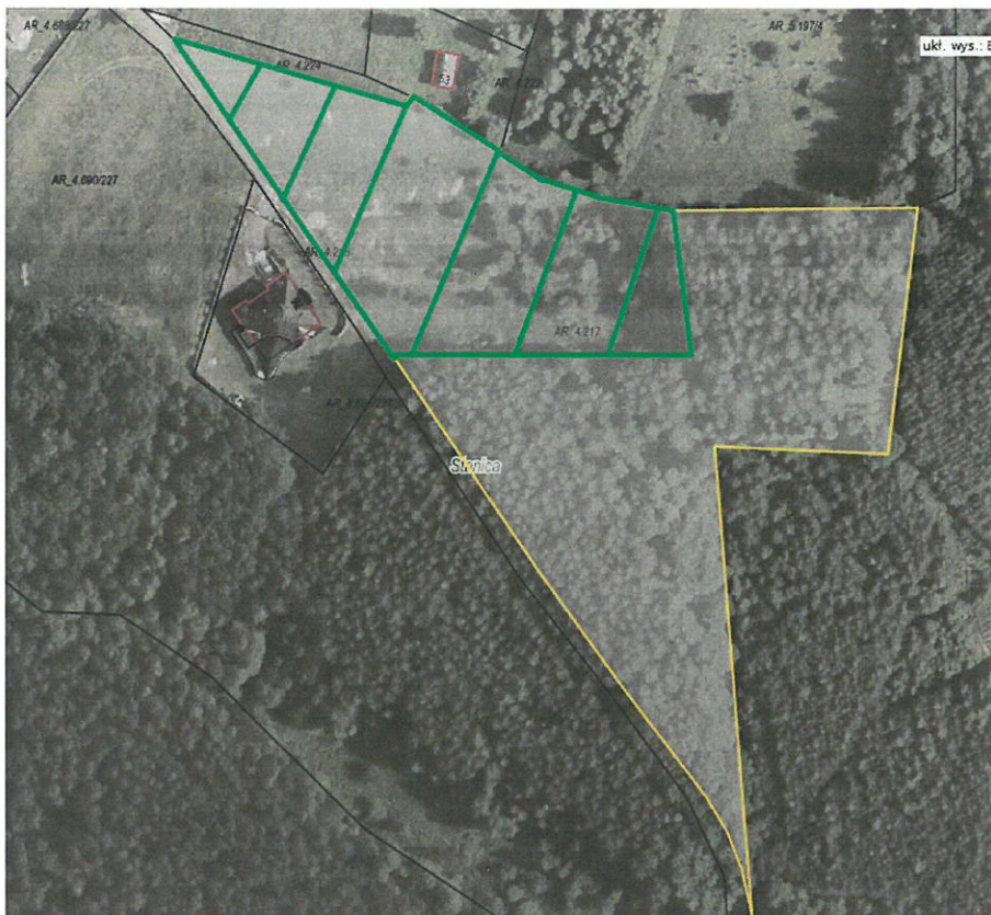
Rys. nr 1 Obszar przeznaczony do dzierżawy oznaczono kolorem zielonym

Zgodnie z danymi ujawnionymi w ewidencji gruntów i budynków, na powierzchnię części działki przeznaczonej do dzierżawy składają się następujące użytki: