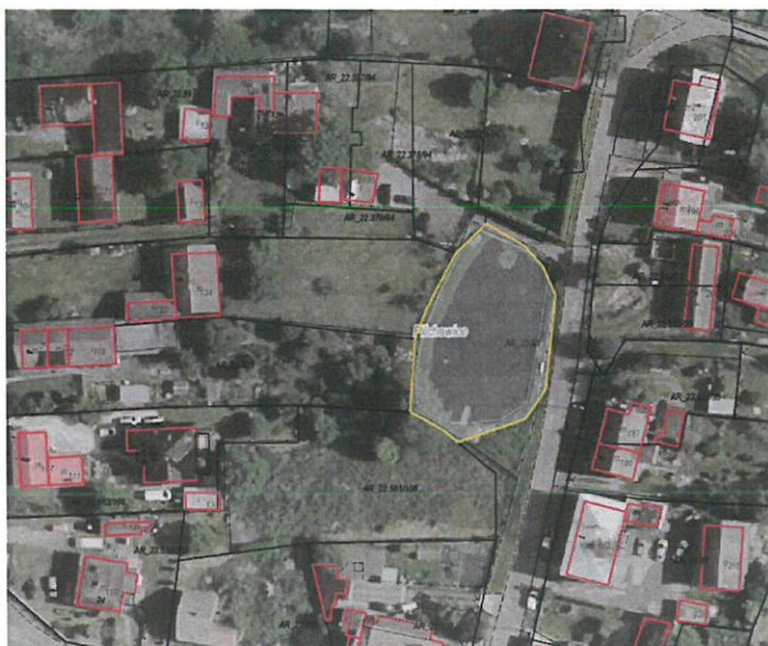
Rys. nr 1 Obszar przeznaczony do dzierżawy oznaczony kolorem żółtym

Działka położona przy ul. Leśnej w Pilchowicach, pokryta wodą powierzchniową stojącą. Kształt działki owalny. Otoczenie stanowi zabudowa mieszkaniowa jednorodzinna. Działka posiada dostęp do drogi publicznej ul. Leśnej w Pilchowicach.