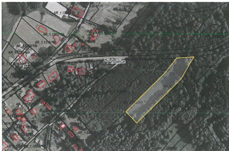
Rys. nr 1 Obszar przeznaczony do dzierżawy oznaczono kolorem żółtym

Działka będąca przedmiotem dzierżawy jest niezabudowana, położona w rejonie ul. Bierawka w Pilchowicach. Działka w użytkowaniu rolniczym, jej kształt jest regularny, prostokątny. Otoczenie stanowią lasy, pola uprawne oraz zabudowa mieszkaniowa jednorodzinna. Działka posiada dostęp do drogi publicznej ul. Bierawka w Pilchowicach poprzez gminną drogę wewnętrzną ogólnodostępną.