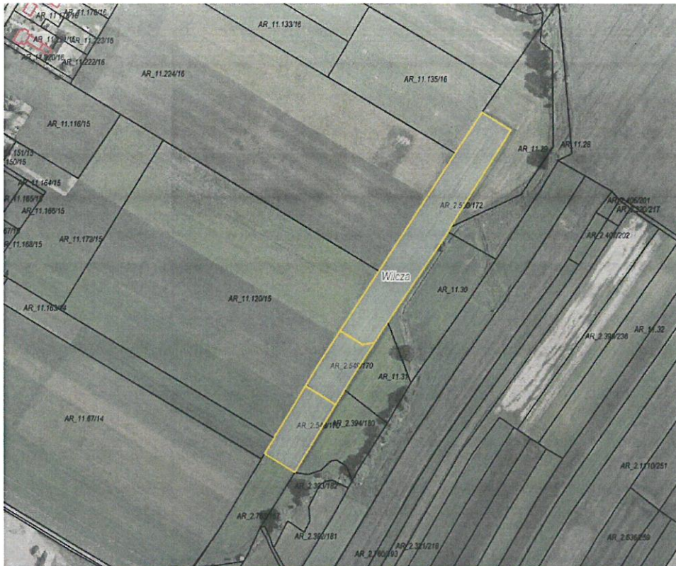
Rys. nr 1 Obszar przeznaczony do dzierżawy oznaczono kolorem żółtym

Zgodnie z danymi ujawnionymi w ewidencji gruntów i budynków, na powierzchnię działek przeznaczonych do dzierżawy składają się następujące użytki: