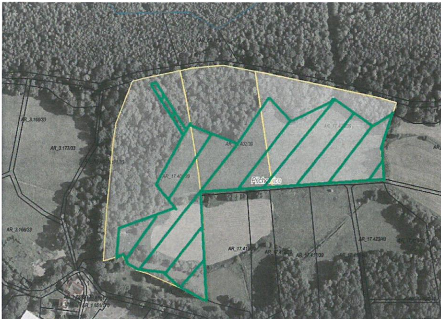
Rys. nr 1 Obszar przeznaczony do dzierżawy oznaczono kolorem zielonym

Zgodnie z danymi ujawnionymi w ewidencji gruntów i budynków, na powierzchnię działek przeznaczonych do dzierżawy składają się następujące użytki: