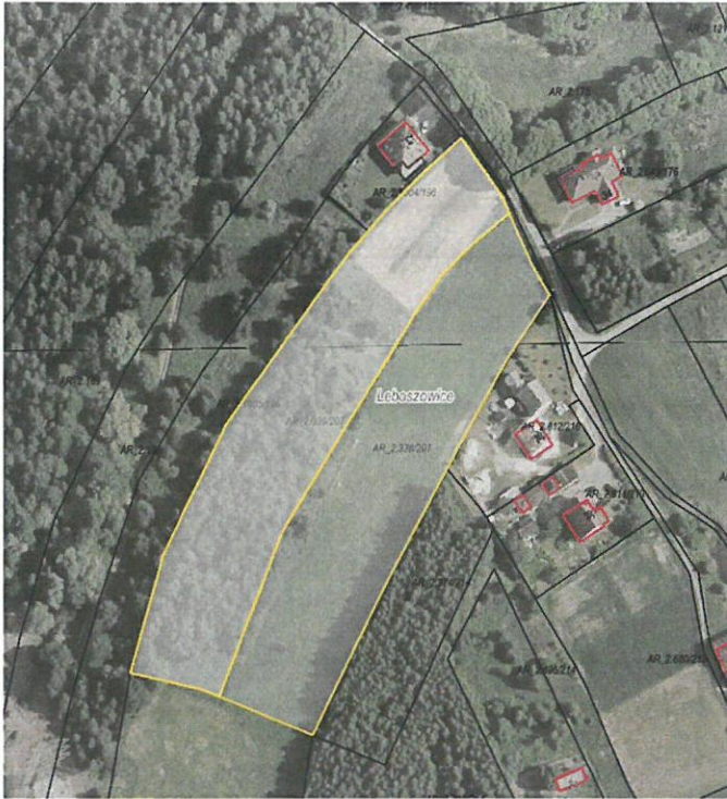
Rys. nr 1 Obszar przeznaczony do dzierżawy oznaczono kolorem żółtym

Zgodnie z danymi ujawnionymi w ewidencji gruntów i budynków, na powierzchnię działek przeznaczonych do dzierżawy składają się następujące użytki: