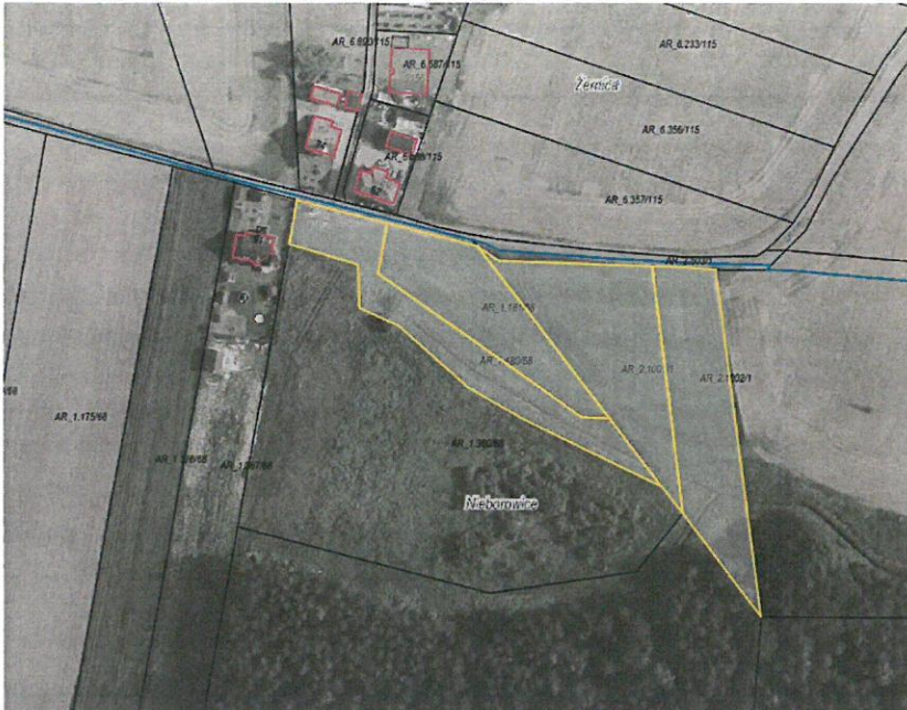
Rys. nr 1 Obszar przeznaczony do dzierżawy oznaczono kolorem żółtym

Zgodnie z danymi ujawnionymi w ewidencji gruntów i budynków, na powierzchnię działek przeznaczonych do dzierżawy składają się następujące użytki: