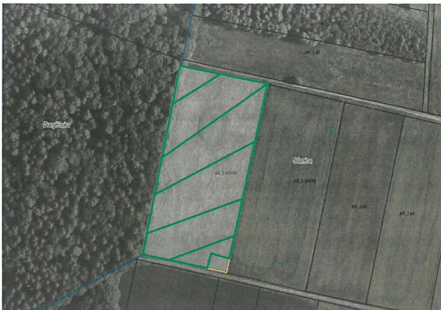
Rys. nr 1 Obszar przeznaczony do dzierżawy oznaczono kolorem zielonym

Zgodnie z danymi ujawnionymi w ewidencji gruntów i budynków, na powierzchnię części działki przeznaczonej do dzierżawy składają się następujące użytki: